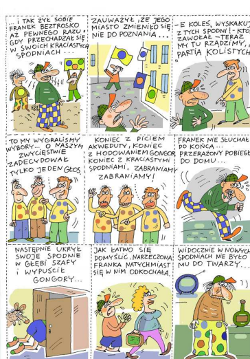
II miejsce (Maciej Trzepałka)